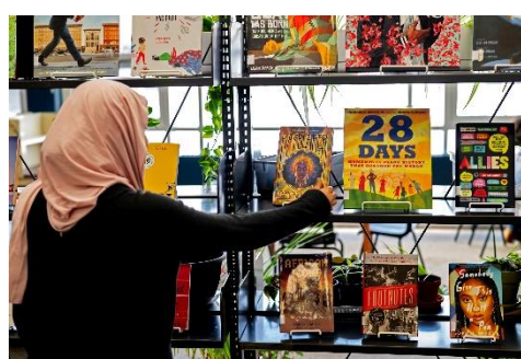
Les ressources de l'équipe de bibliothécaires pour le Mois de l'histoire des Noirs

Que vous recherchiez des récits éclairants sur des événements historiques ou des célébrations vibrantes de l'héritage des Noirs, la sélection diversifiée de l'équipe de la bibliothèque offre quelque chose à chaque lecteur.