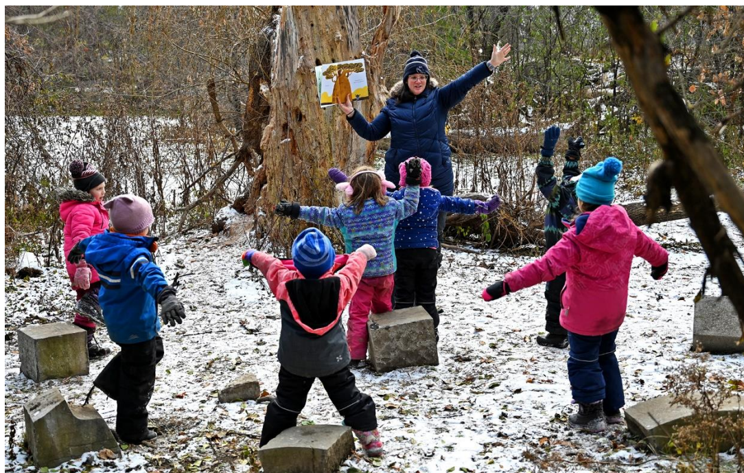
Le programme Maternelle immersion dans la nature.

Joignez-vous à moi pour lire et célébrer les efforts et les réalisations de ceux qui composent la CSWQ ! g