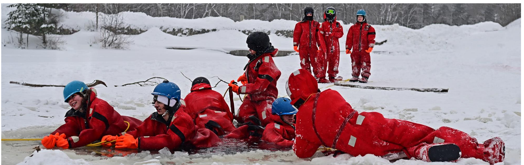
Certification en survie sur glace avec Boreal River Rescue à l'école secondaire St-Michael's