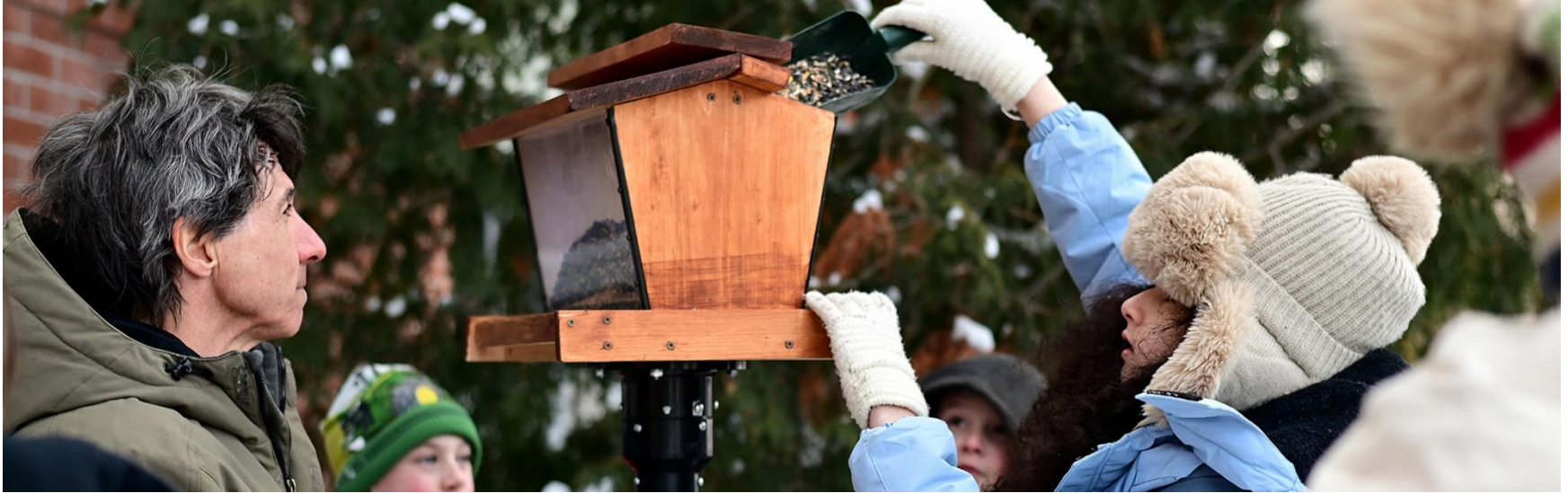
Remplissage d'une mangeoire pour oiseaux fabriquée en menuiserie avec Alan Earwaker. École primaire Eardley.