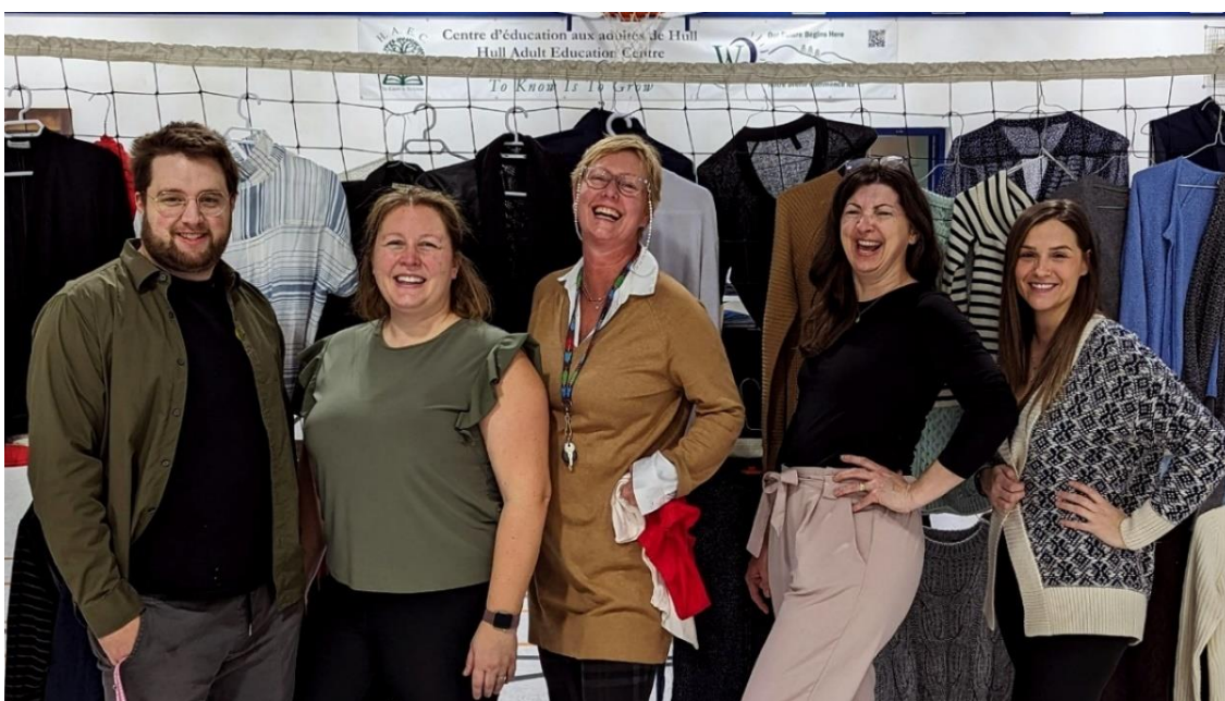
L'événement annuel « Freecycle » du centre d'éducation aux adultes de Hull.