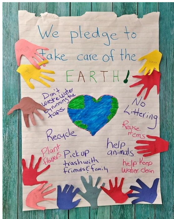
Jour de la Terre à G-Théberge

À G-Theberge, les enseignants intègrent les activités du Jour de la Terre dans le programme scolaire toute l'année, en abordant les aspects du réchauffement climatique et les questions environnementales.