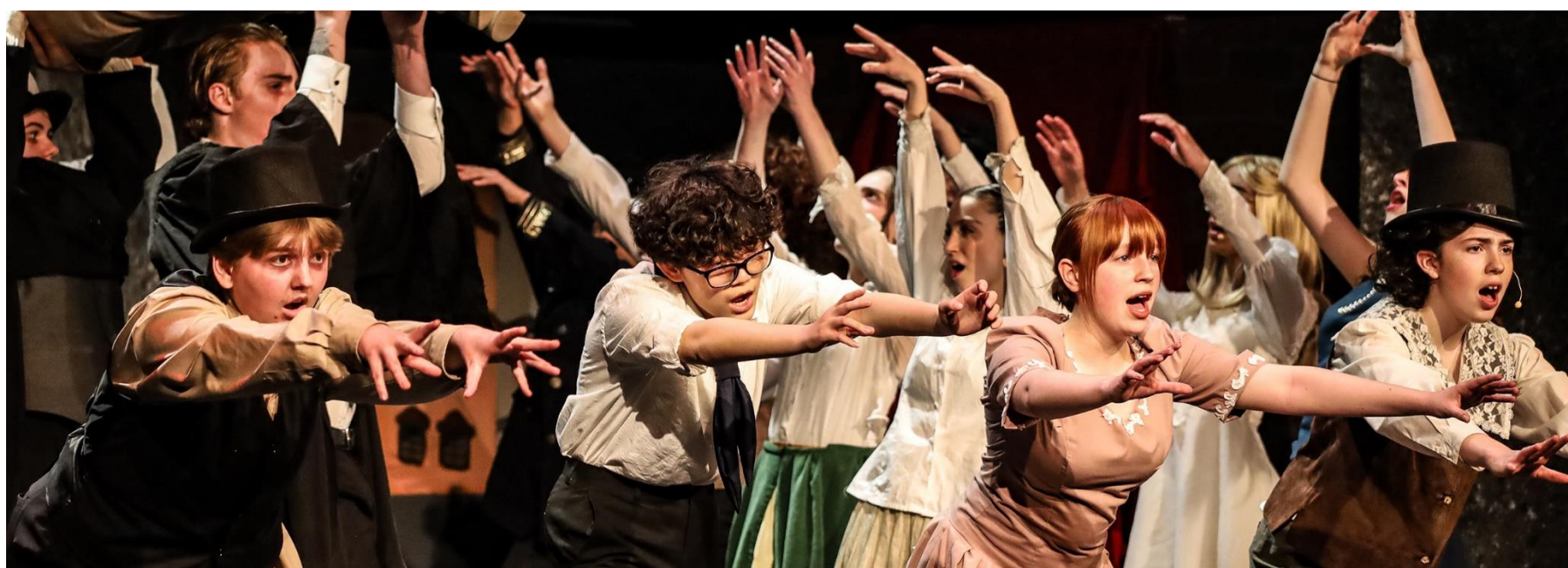
de la performance de Sweeney Todd à l'école secondaire Hadley/Philemon-Wright