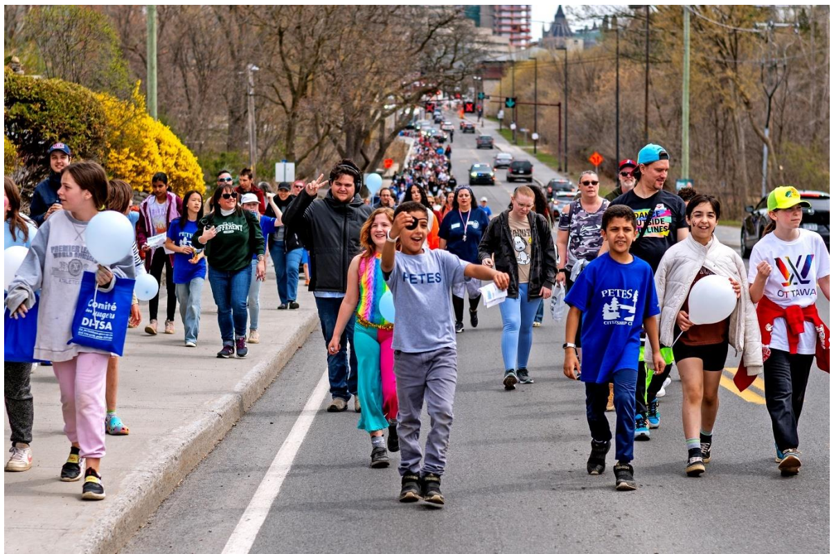
Marche de l'autisme, organisée par PETES en partenariat avec Trait d'Union Outaouais Inc.