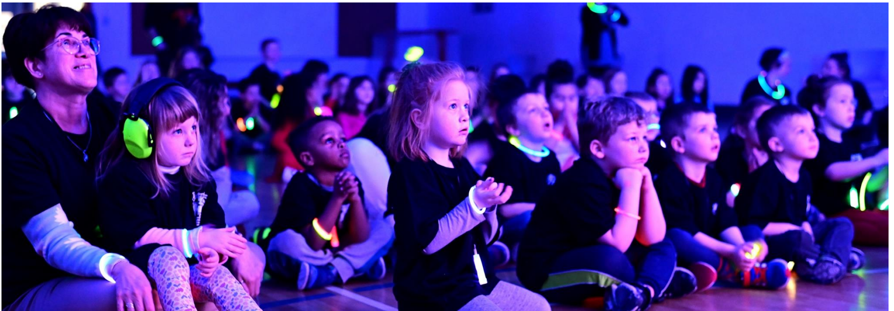
à l'école primaire de Buckingham