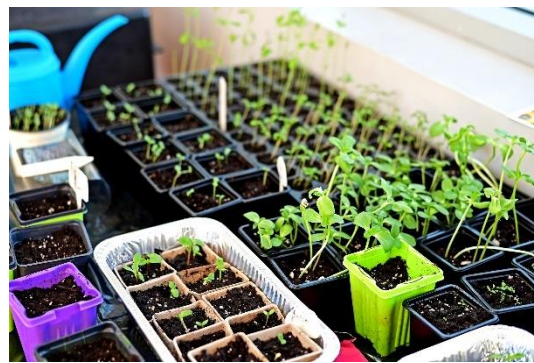
Projet de Jardin d'école.

Le printemps est arrivé, apportant avec lui la chaleur et l'enthousiasme de la saison du jardinage.