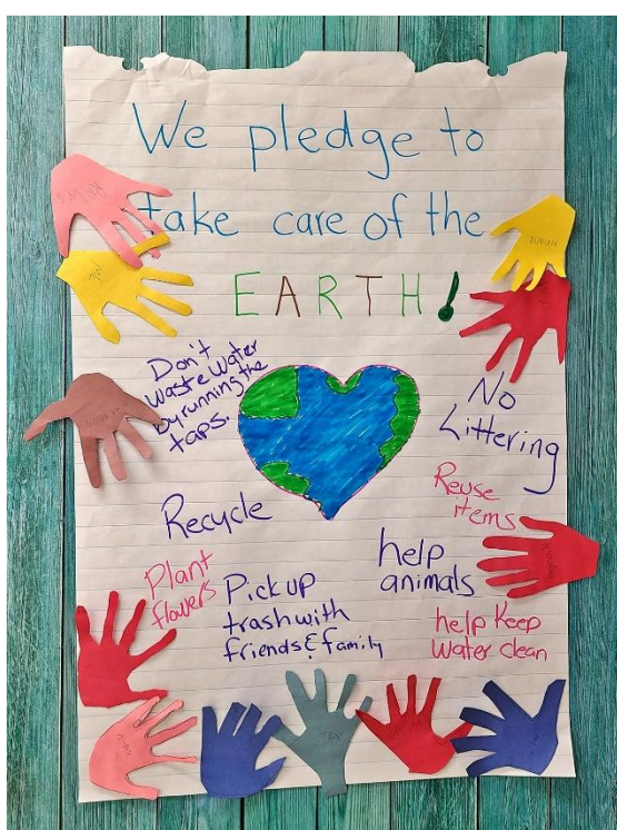
Jour de la Terre tous les jours p. 6.