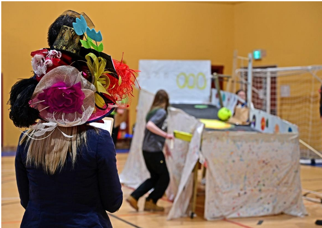
Destination Imagination organisé par l'école secondaire Symmes/D'Arcy-McGee le 22 mars