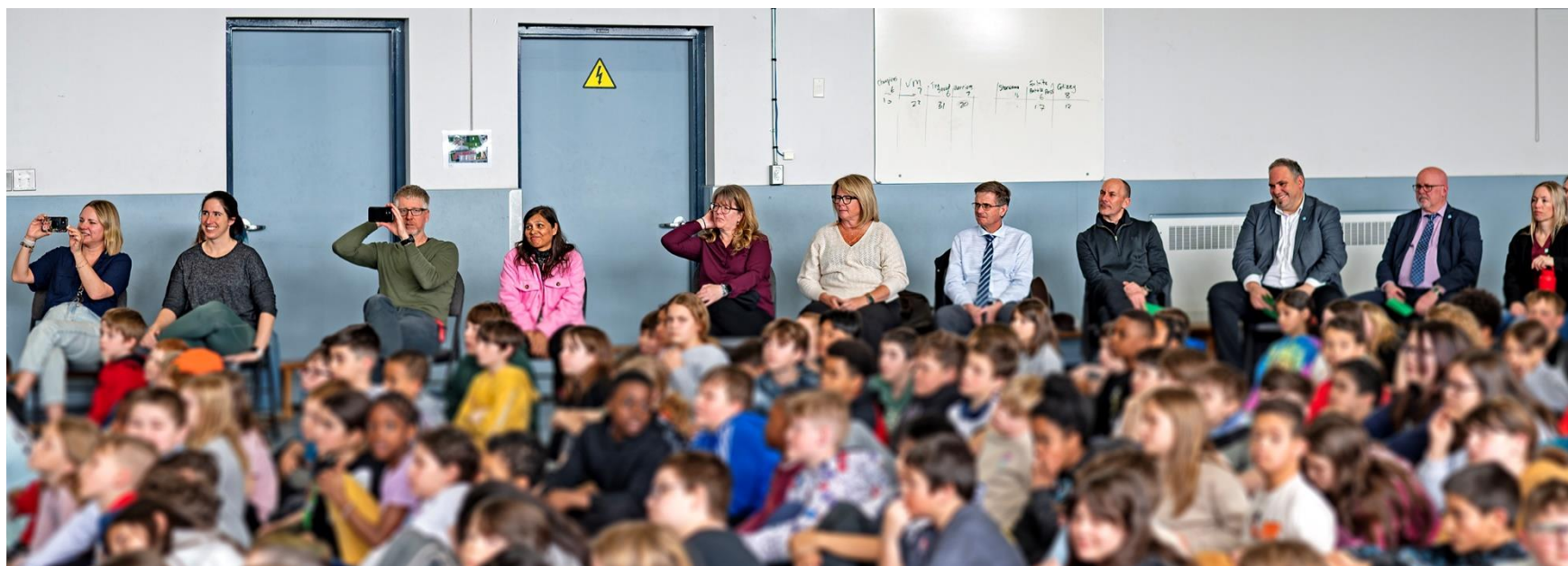
Persomnel de la haute direction de la CSWQ et persomnel de l'école à la performance de l'école primaire Greater Gatineau