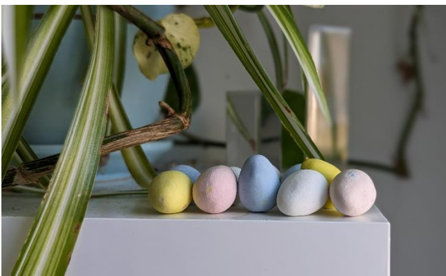
Joyeuses Pâques ! La longue fin de semaine de Pâques se déroule du 29 mars au 1er avril.