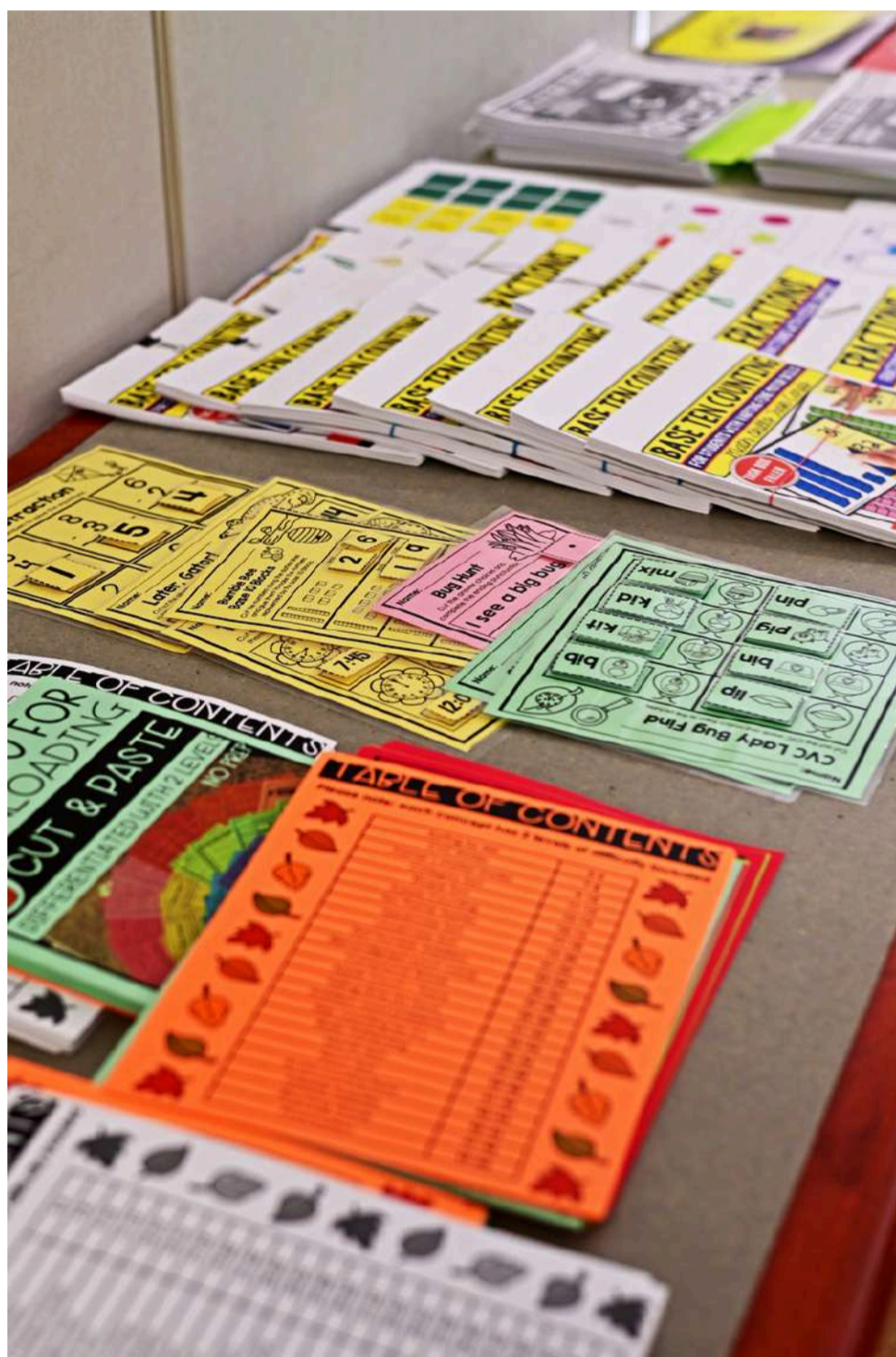
Tableau rempli de ressources pour tous les niveaux d'apprentissage

Après-midi : Technologie d'aide – Conseillers en technologie éducative : Stuart Gray et Lisa Diner.