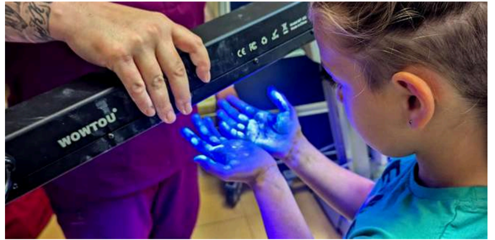
Démonstration de lumière fluorescente révélant de faux germes