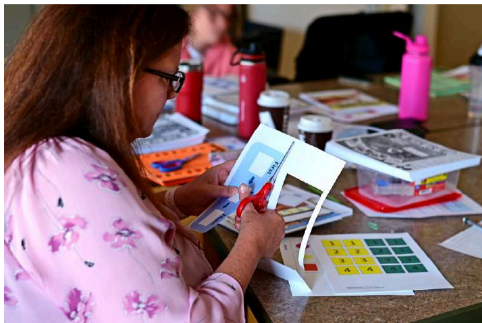
Les techniciens en éducation spécialisée créent des ressources après la présentation