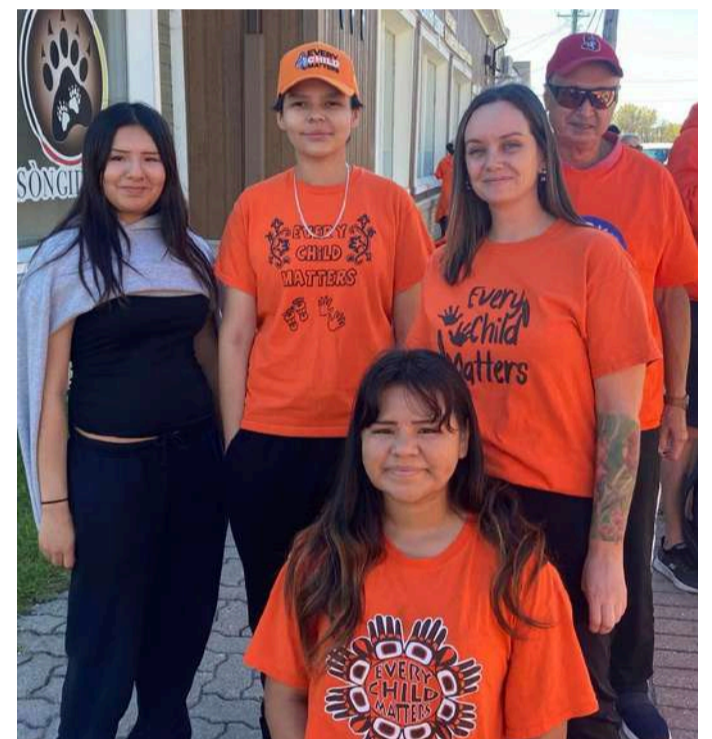
Centre de formation continue du Pontiac