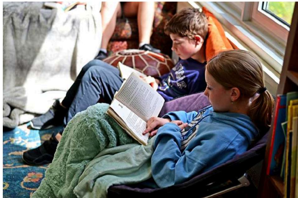
Elèves lisant à l'École Intermédiaire de Namur

*La ressource est également disponible en anglais.