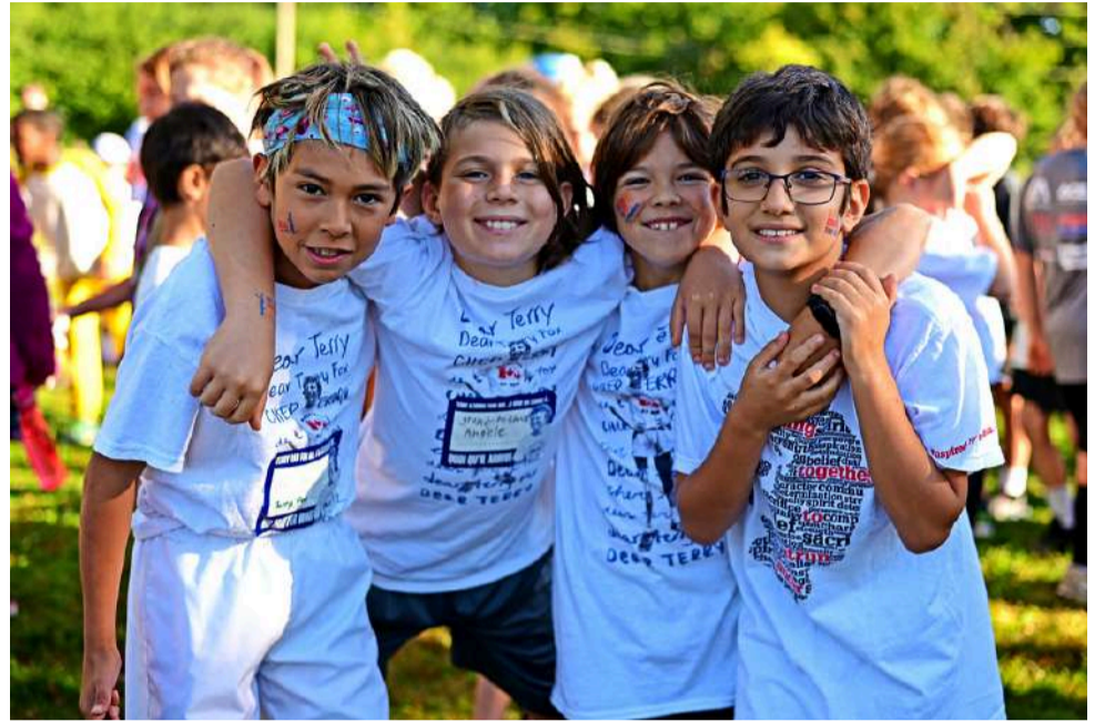
« J'ai attendu ça toute ma vie », s'exclame un garçon qui fête son anniversaire.