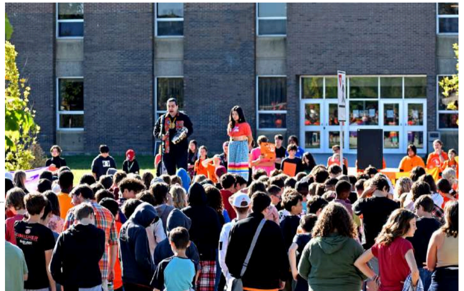
Hadley Jr/PWHS