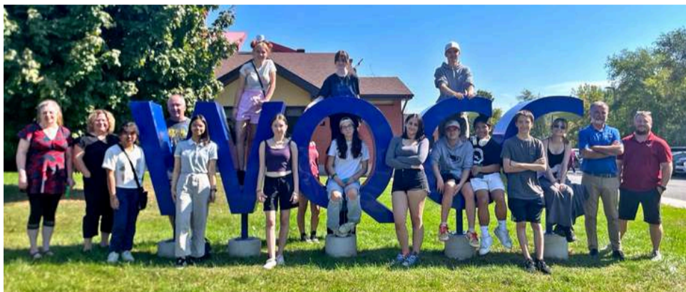
Photo de groupe prise avec les lettres WQCC faites par les étudiants à l'extérieur du centre

Les élèves de 3e, 4e et 5e secondaire de Noranda ont récemment effectué une visite fructueuse et bien remplie dans la région de Gatineau/Ottawa. La première journée, ils ont visité le Musée de l'histoire, le Parlement et le CÉGEP Heritage College. La deuxième journée, ils se sont rendus au Centre des carrières Western Québec (CCWQ), où ils ont eu droit à une visite guidée du bâtiment et ont pu découvrir tous les programmes offerts. Ils ont également eu le temps de faire du magasinage et de visiter Funhaven à Ottawa. Ils sont revenus à Rouyn-Noranda à la fois épuisés et comblés!