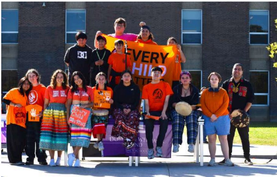
École Woodland de Maniwaki

Cliquez pour regarder la marche pour Wenjack du lycée Hadley Jr./Philemon Wright