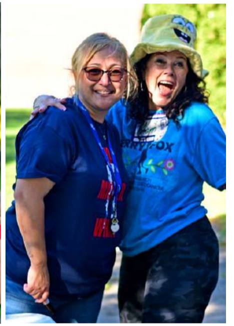
Les étudiants et les membres du personnel ont participé avec plaisir à l'événement !

Extrait de la page Facebook de la vie étudiante de l'ESP