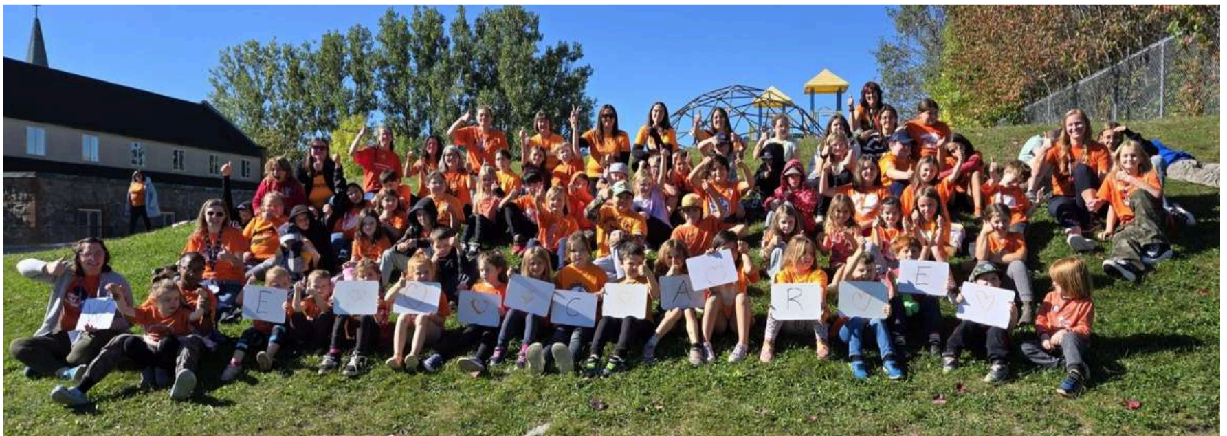
École G. Thériège