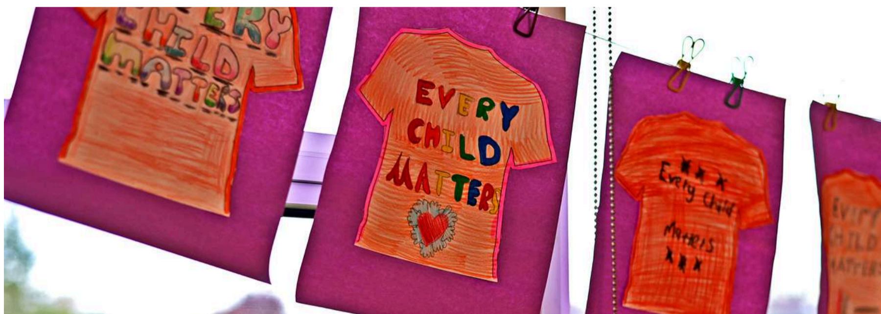
Chaque enfant compte : une œuvre d'art réalisée par des élèves de l'école primaire du Grand Gatineau