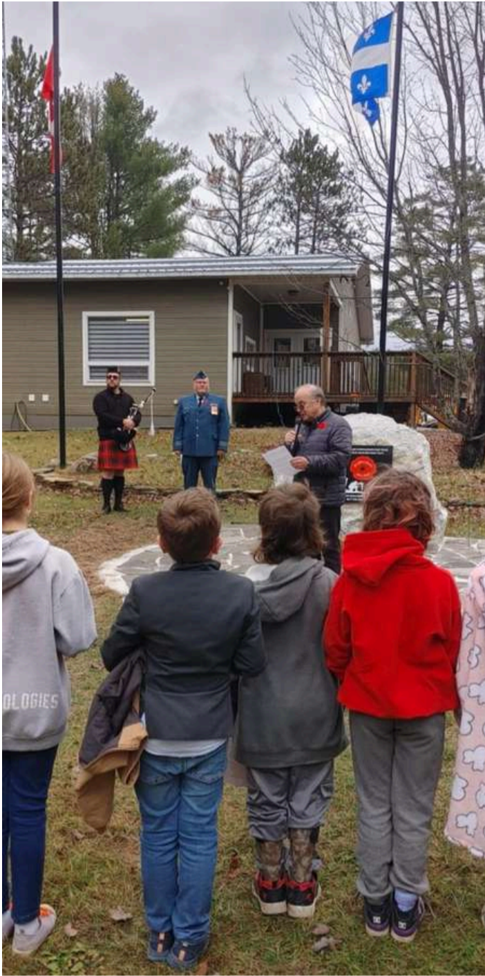
École secondaire Queen Elizabeth - par Alana Albert