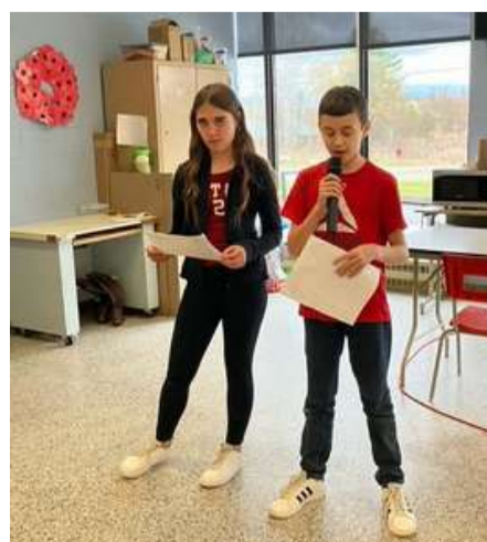
École primaire de St.John's - par Lorianne Bertrand