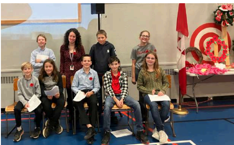
École primaire Dr S.E. McDowell - par Bessie Tsatoumas