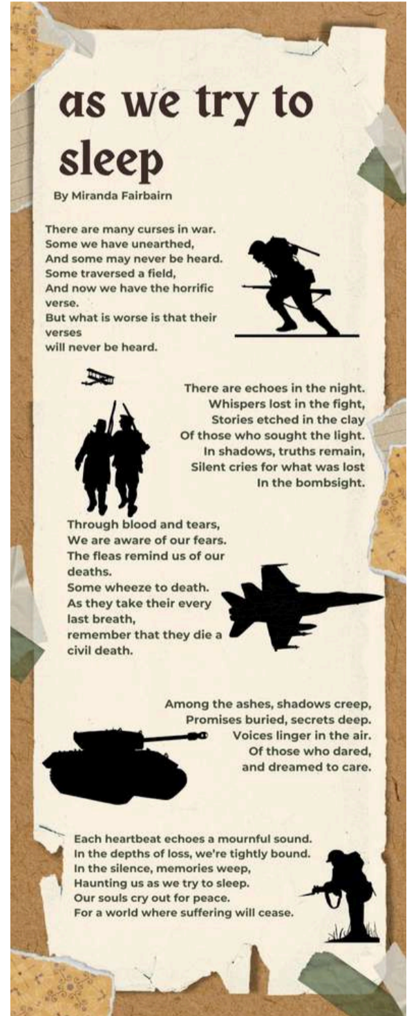
École secondaire St.Mike's - par Nadine Reason