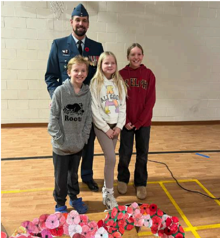
École primaire Wakefield - par Julie Fram-Greig