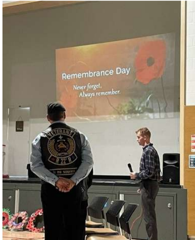
École Golden Valley - par Stephanie Frigon